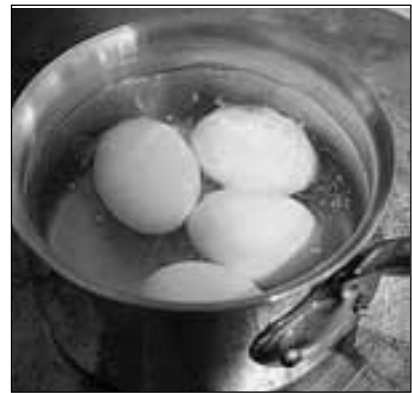
Кастрюля! Вот верное средство от неурядиц с яйцами!

На Физтехе тем временем стали чинить воду. Экскаватор ковшом по трубе